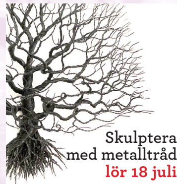
Skulptera med metalltråd lör 18 juli