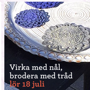
Virka med nål, brodera med tråd lör 18 juli

09.00-12.00 Testa att tälja – lär dig göra knopplister