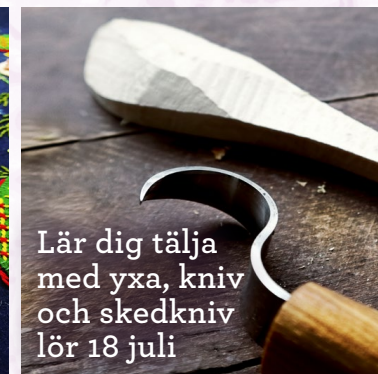
Lär dig tälja med yxa, kniv och skedkniv lör 18 juli