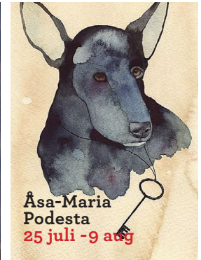
Åsa-Maria Podesta 25 juli - 9 aug