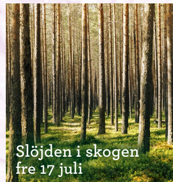
Slöjden i skogen fre 17 juli

PRIS 500 KR (MATERIAL INGÅR, MAX 10 DELTAGARE)