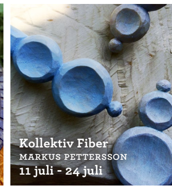
Kollektiv Fiber MARKUS PETERSSON 11 juli - 24 juli