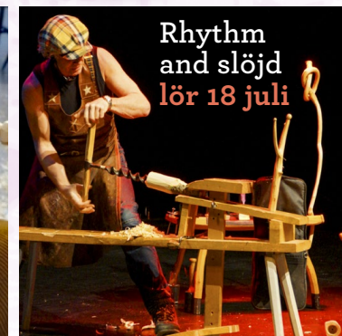
Rhythm and slöjd lör 18 juli