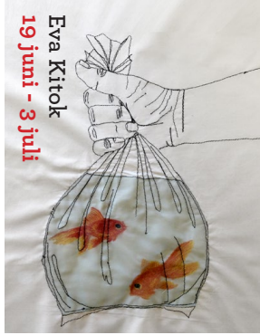
Eva Kitok 19 juni - 3 juli