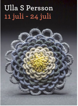
Ulla S Persson 11 juli - 24 juli