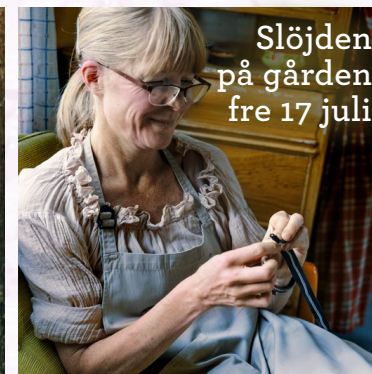
Slöjden på gården fre 17 juli