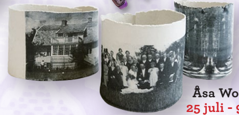
Åsa Wolgast 25 juli - 9 aug