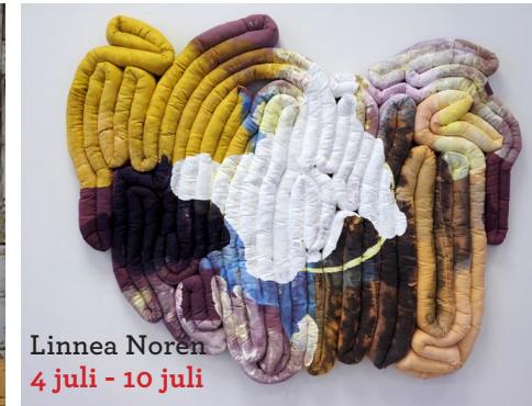
Linnea Noren 4 juli - 10 juli