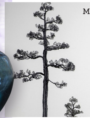
Matilda Bengtsson 11 juli - 24 juli