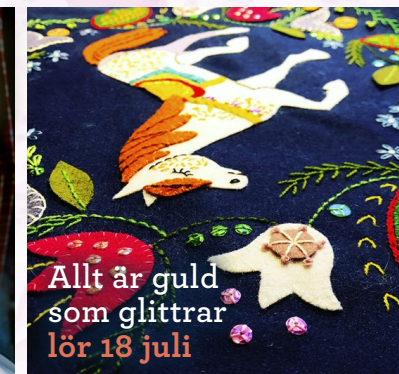
Allt är guld som glittrar lör 18 juli