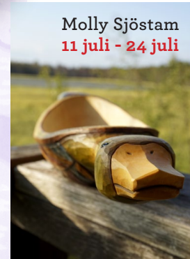
Molly Sjöstam 11 juli - 24 juli