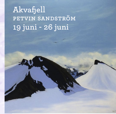
Akvafjell PETVIN SANDSTRÖM 19 juni - 26 juni