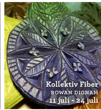
Kollektiv Fiber ROWAN DIGNAM 11 juli - 24 juli