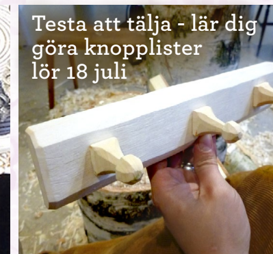
Testa att tälja - lär dig göra knopplister lör 18 juli