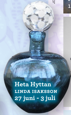
Heta Hyttan LINDA ISAKSSON 27 juni - 3 juli